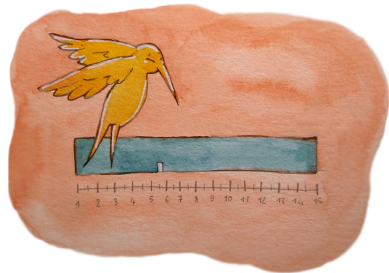
4. Mesurer la distance obtenue

La mesure en mm vous donne votre tour de doigt (exemple : 52 mm = 52). Si elle est entre deux tailles, prenez la taille supérieure .