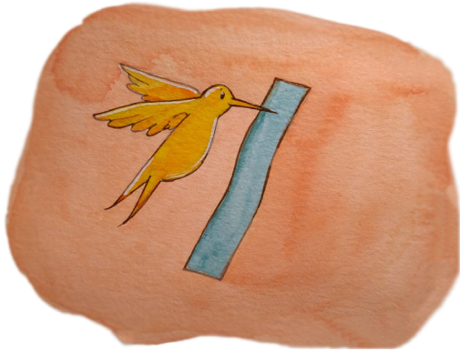
1. Prendre un ruban de papier